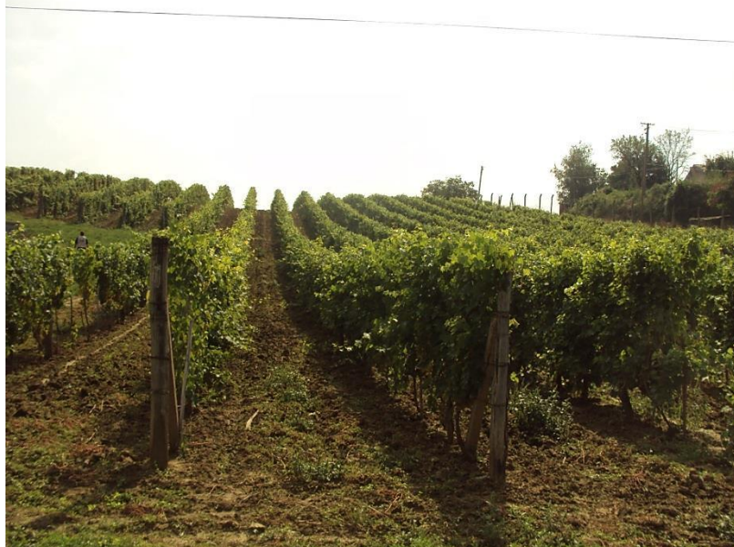
Ogledno dobro Poljoprivrednog fakulteta, Sremski Karlovci

Tokom 70 godina postojanja ustanove, timovi stručnjaka vinogradara i oplemenjivača su intenzivno radili na unapređenju tehnologije proizvodnje grožđa i vina, na kolekcionisanju, čuvanju i ispitivanju velikog broja autohtonih i introdukovanih sorti, ali i na stvaranju novih sorti vinove loze i klonskoj selekciji gajenih sorti. Stvorene su sorte boljih proizvodnih karakteristika od starih, u prošlosti gajenih sorti, zatim sorte otpornije na mraz, otpornije na gljivične bolesti i ostale faktore stresa.